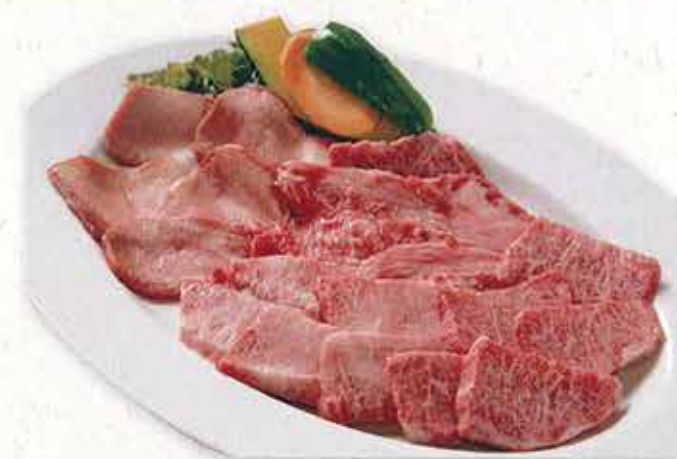
日本牛上等肉和上等盐味牛舌拼盘